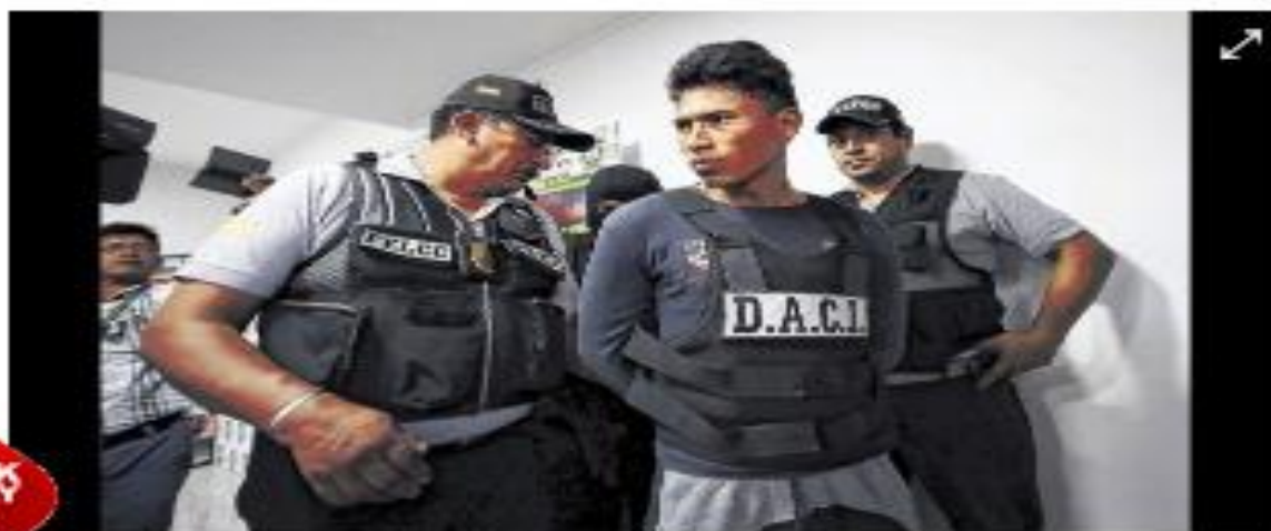
La muchacha había salido bachiller hace dos años y quería estudiar administración

Según la versión del novio, él despertó cuando el autor del crimen lo estaba estrangulando y cuando encendió la luz, vio a su pareja ensangrentada. La muchacha había dicho a su novio dos veces que su amigo la estaba acosando