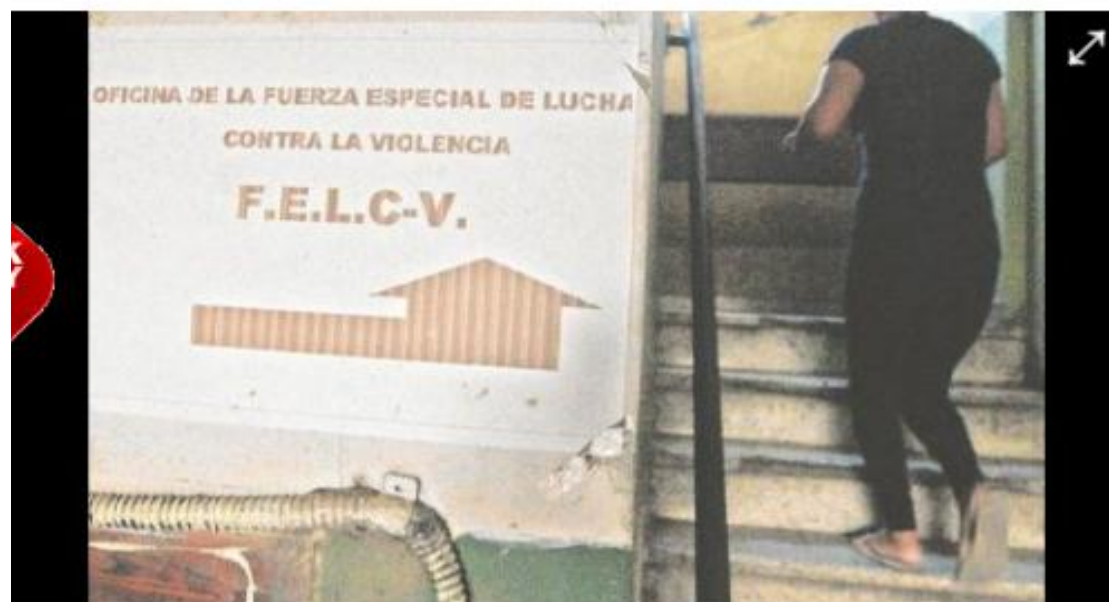
En el primer semestre de este año, según los datos de la Fiscalía, se registraron 726 casos de violación

Según la denuncia, la chica de 13 años iba como pasajera en el bus y el chofer desvió su ruta y, en un lote baldío procedió al ultraje sexual. Después desapareció